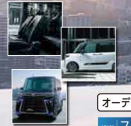
Photo:タントカスタムRS 2WDハイブリッドのクルーザーのラックマイカM(X07)×サンドベージュM(色34)(XME)はメーカーオプションで55,000円(消費税込)です。また、クルーザーのラックマイカM(X07)×サンドベージュM(色34)(XME)はメーカーオプションで55,000円(消費税込)です。また、クルーザーのラックマイカM(X07)×サンドベージュM(色34)(XME)はメーカーオプションで55,000円(消費税込)です。