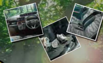
Photo:タント ファンクロス ターボ 2WD (ボディカラーのブラックマイカM(X07)×サンドベージュM(色34)(XME)はメーカーオプションで55,000円(消費税込)です。また、ボディカラーのブラックマイカM(X07)×サンドベージュM(色34)(XME)はメーカーオプションで55,000円(消費税込)です。また、ボディカラーのブラックマイカM(X07)×サンドベージュM(色34)(XME)はメーカーオプションで55,000円(消費税込)です。