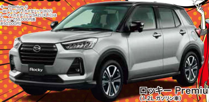
Photo:ロッキーPremium G (ボディカラーはブラックメタリック(X07) /ブルーメタリック(X42)(XL1))は メーカーオプションで55,000円高 (消費税抜き50,000円)