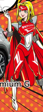
ロッキー Premium G (1.2L ガソリン車) (2WD-CVT) オーディオレス

メーカー希望小売価格車両本体価格(消費税込み) 2,058,000円 消費税抜き価格1,870,909円